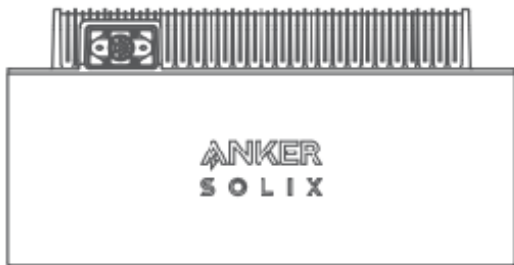
Anker SOLIX BP1600 Erweiterungsakku