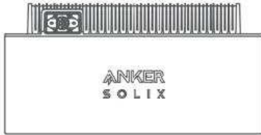
Anker SOLIX BP1600 Erweiterungsakku